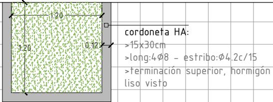
Cantero 1.20x1.20 Planta esc: 1/50